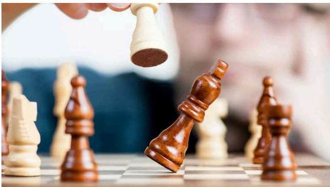
Weesper Schaakclub houdt het Open Kampioenschap van de stad Weesp