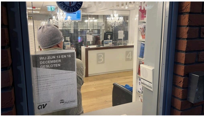
'Maar ik sta wel tussen twee vuren: mijn medewerkers en de verzekeraar(s), fabrikant en de overheid'