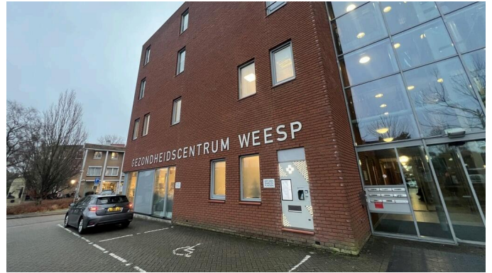
Apotheken in Weesp doen mee aan regionale staking