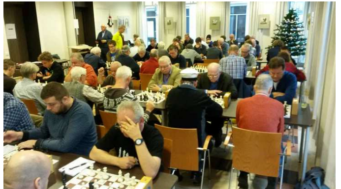
Weer een Weesper schaakkampioen