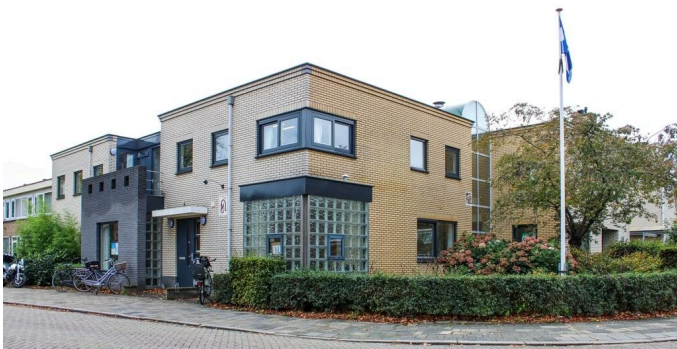
Uitdeelpost en medicijnenautomaat in wijk Hogewey moeten verhuizing apotheek opvangen