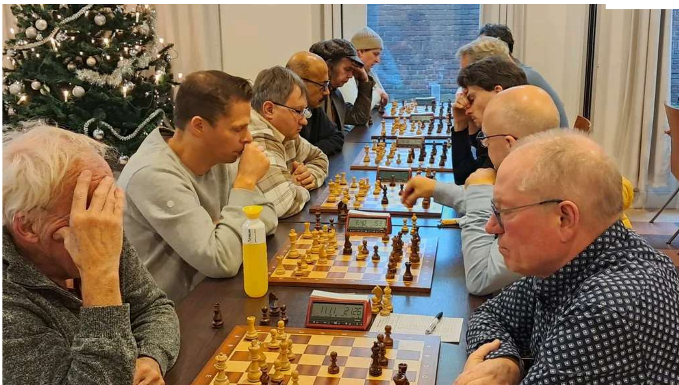
Overzicht van de 1e bord.