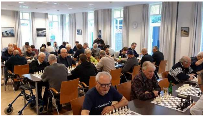
Open Schaakkampioenschap van de Stad Weesp