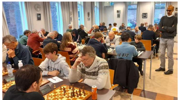
Open Schaakkampioenschap van de Stad Weesp is gewonnen door een Amsterdammer