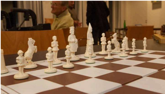
Volgende week 35e Schaakkampioenschap van de Stad Weesp