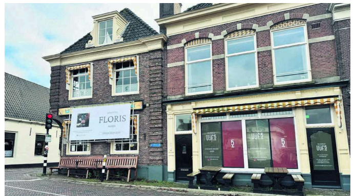
Wijnbar Vijf & Brasserie Floris Muiden