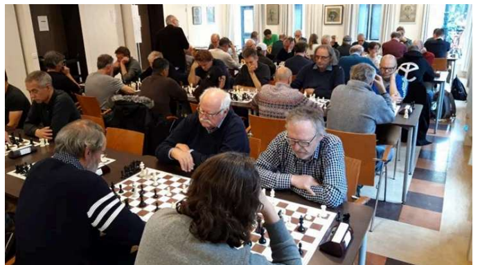
Open Schaakkampioenschap van de Stad Weesp op 4 december

Voorproefje WeesperNieuws Extra? Schrijf je in voor de dagelijkse nieuwsbrief