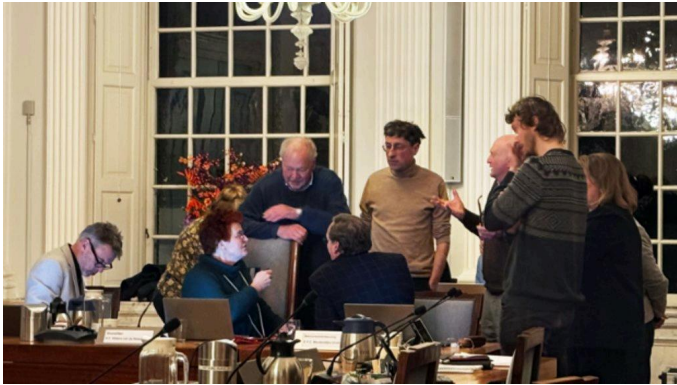
Bewoners Weespersluis verzetten zich tegen intrekking exploitatieplan