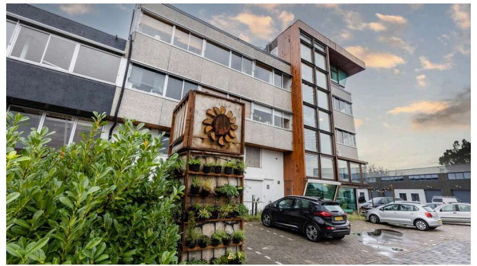
Kijkje achter de schermen Bloom Studios