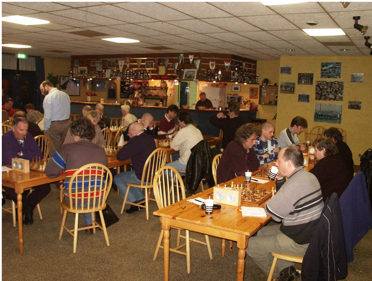
De wedstrijdleader vindt nog tijd voor andere partijen

Bert staat hier uitstekend, de zwarte dame en koning staan op de tocht en de stelling schreeuwt om Pd5 . Na het gespeelde 20.Pc2 heeft wit nog steeds voordeel, maar er is toch een mooie kans aan zijn neus voorbij gegaan. Een vervolg had kunnen zijn Lxd5 21.exd5 Dd7 22.Pc4! e4 23.Pe5 Dxd5 24.Pc6+! Ka8 25.De3 Dd7 Td7 26.Db6 26.Tfd1 Db7 27.Pa5 Txd1+ 28.Txd1 Dc7 29.Lxe4+ en de zwarte stelling wordt opgerold.